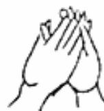
10. Vajrapradama Mudrá