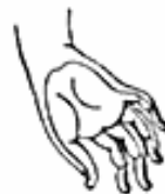
6. Varada Mudrá