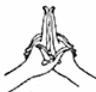
7. Uttarabodhi Mudrá