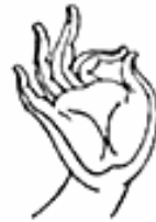
2. Vitarka Mudrá