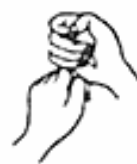
8. Mudrá of Supreme Wisdom